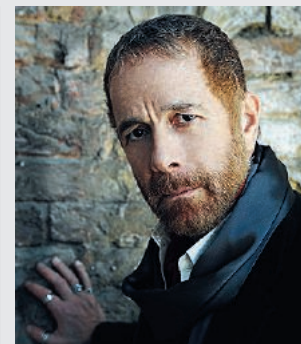
L'attore Gabriele Lavia, presto a Como

Torna a grande richiesta sul palcoscenico del Teatro Sociale di Como in piazza Verdi l'attore Gabriele Lavia, interprete del primo atto della stagione "Ct1" lunedì 15 ottobre alle ore 20.30 al Teatro Sociale di Como con Lavia dice Leopardi . Sarà un intenso monologo che esplora quella foresta di parole fatte pensiero e pensieri divenuti poesia che è l'opera del grande recanatese. Un'occasione per naufragare in un mare di bellezza, da A Silvia a